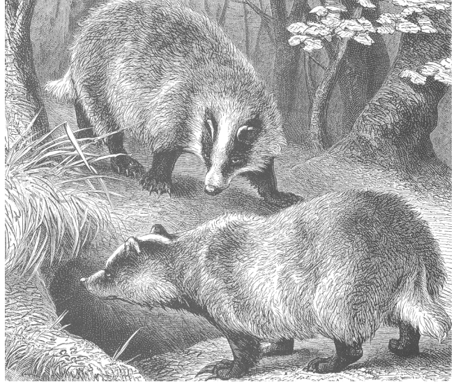
Dachse sind gesellige Tiere

Es gibt mancherlei Vorurteile gegenüber dem scheuen Dachs. Da heißt es in alten Büchern etwa: „Das vollendetste Bild eines selbstsüchtigen, misstrauischen, übellaunigen und gleichsam mit sich selbst im Streit liegenden Gesellen ist der Dachs“. Er wurde als mürrischer Einzelgänger dargestellt, ohne Familiensinn, der mit seinen Artgenossen wenig im Sinn habe. Was falsch ist, denn im Dachsbau leben meist mehrere Familien zusammen, die sich gegenseitig helfen. Was der Naturforscher Carl von Linné, Erfinder der zoologischen Systematik, schon 1669 mit den Worten beschrieb: „Wenn sie alt und blind werden / gehen sie nicht mehr auß / sondern werden von den Jüngeren unterhalten“.