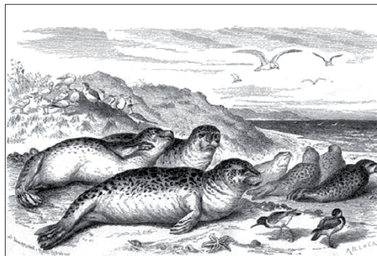
Nach einem Stich von 1880

Der Pflege-Roboter-Seehund „Shiro“ ist ein schneeweißes, körperwarmes Kuscheltier mit Kindchen-Schema, das auf Sprache und Bewegung reagiert, das krächzt und weint, zum Spiel auffordert und die Augen rollt, aber auch energisch seinen Unwillen äußert – es schläft erst ein, wenn es ausgiebig gestreichelt worden ist. Was beiden guttut, ganz besonders aber den alten Menschen. Ebenso in der deutschen Bevölkerung ist der Seehund sehr beliebt, was sich auch im regen Besuch der Heuler-Aufzuchtstationen zeigt. Ein Hinweis ist ebenfalls die Tatsache, dass das Bild vom Seehund, der in der Sprechblase „Moin, Moin“ sagt, beim marktführenden Postkartenverlag Deutschlands die am meisten verkaufte Ansichtskarte ist.